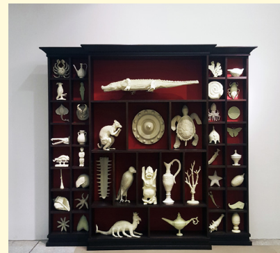
Mark Dion, The Unruly Collection, 2015 Cabinet en bois, peinture lumineuse et 43 sculptures de papier mâché et plâtre, 220 x 250 x 30 cm. Pièce unique. Galerie In Situ - fabienne leclerc, Paris