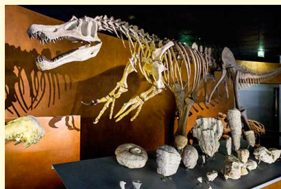
Museum d'histoire naturelle à Toulouse.