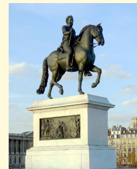
François-Frédéric Lemot, Statue équestre d'Henri IV, 1818. Bronze. Pont Neuf, Paris.