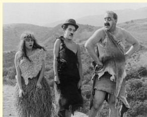
Charlie Chaplin, His prehistoric past, court métrage muet, 1914 (33mn).