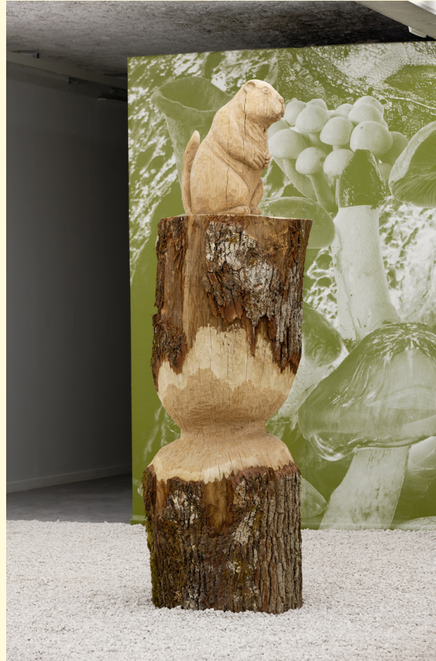
Castor, 2021. Chêne, 250×70×70 cm.