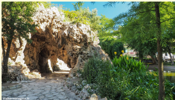
Jardin du Château d'eau à Sète. Décor en rocaille ; fausse grotte tapissée de fragments de stalactites et disposant d'un passage traversant.