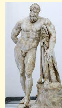
Glycon d'Athènes, Hercule Farnèse, IIIè siècle. Marbre. Musée archéologique national de Naples.